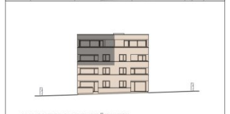
HAUS WEST ANSICHT SÜDWEST