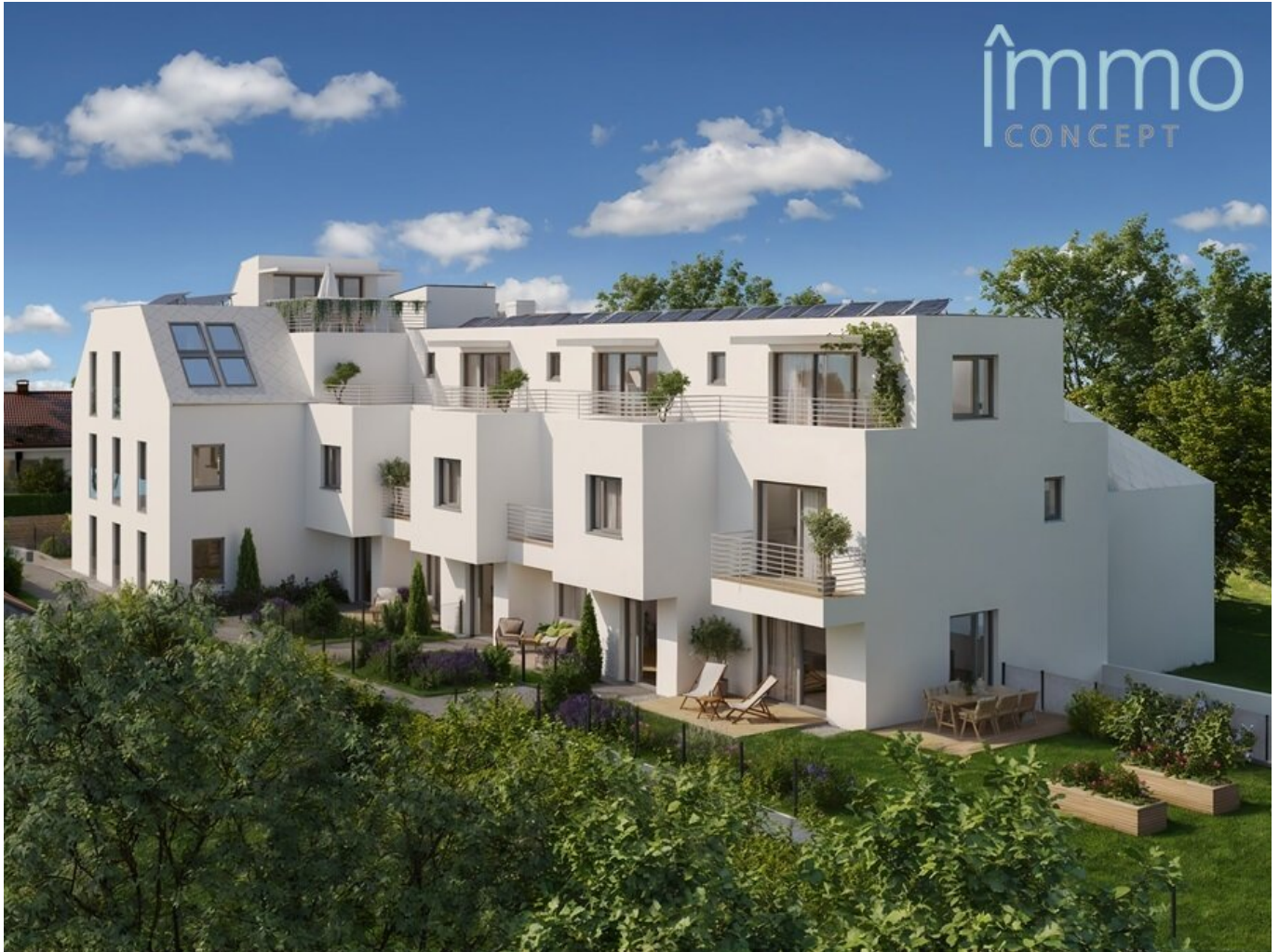
Ansicht Parkgarten Mauer