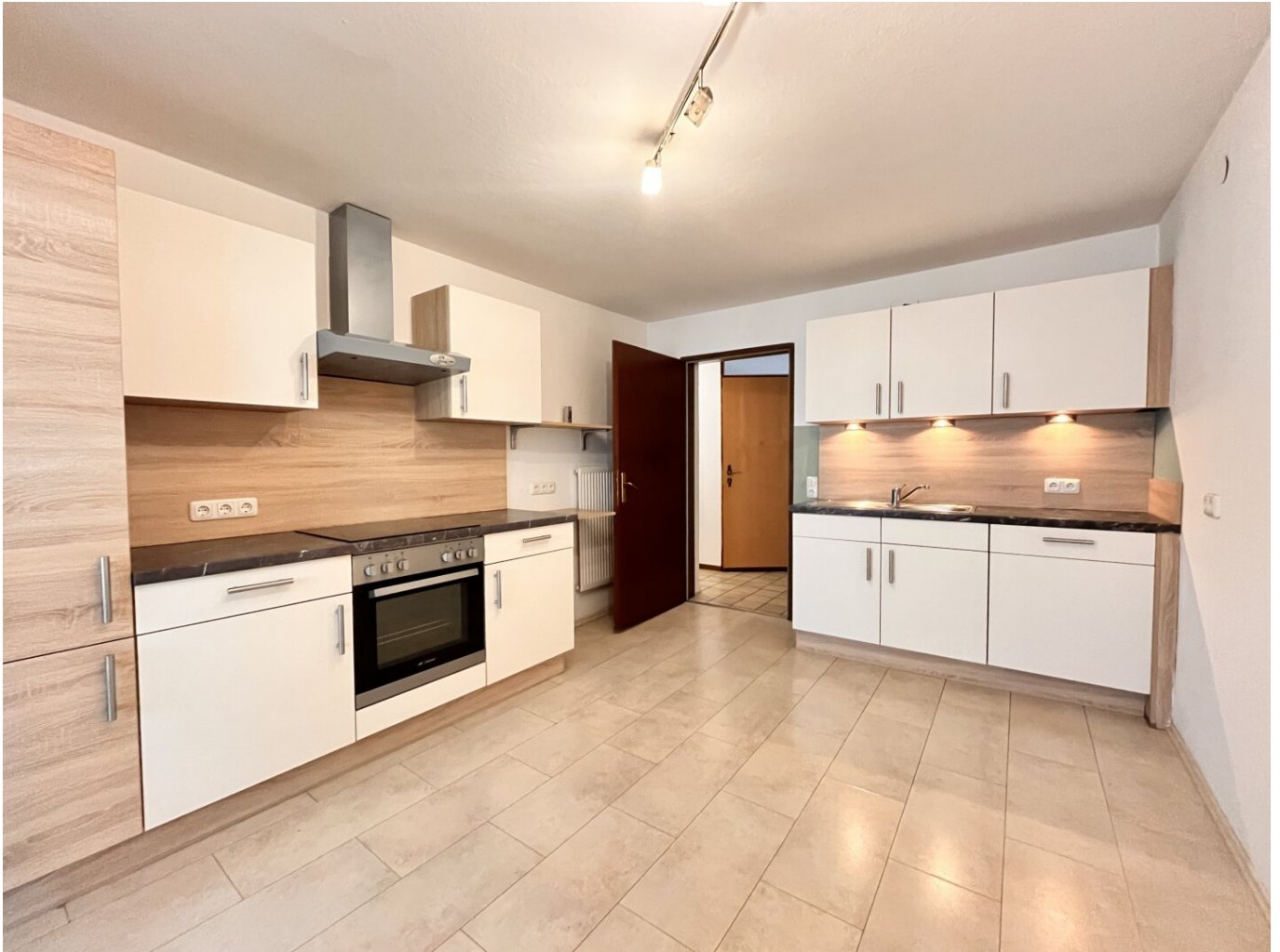
Küche 1. Obergeschoss mit Balkon