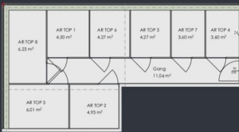
Abstellräume der Wohnungen Haus B im Erdgeschoss