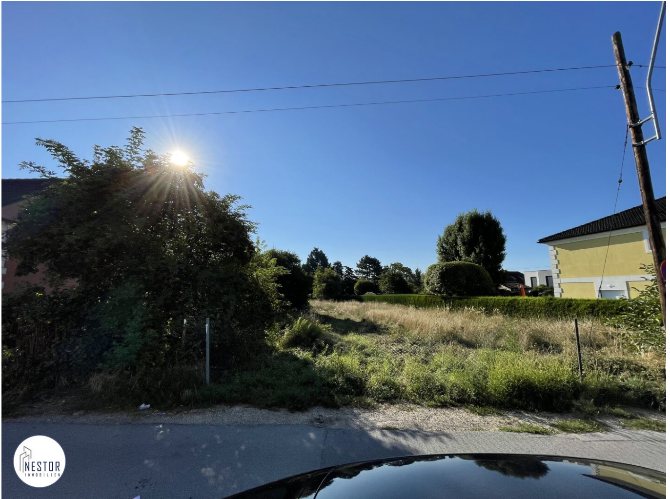
Grundstück - NESTOR Immobilien