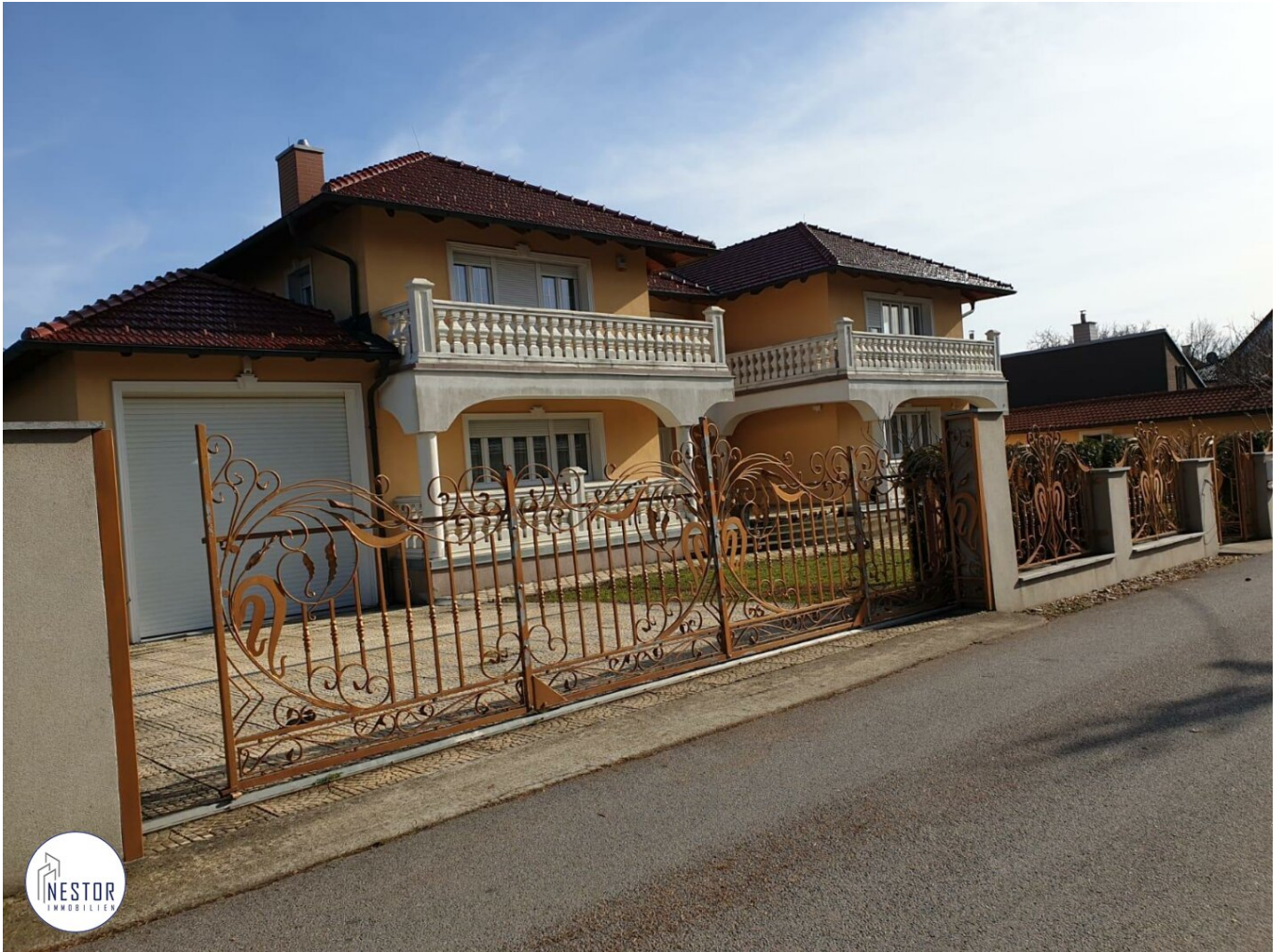
Villa - NESTOR Immobilien