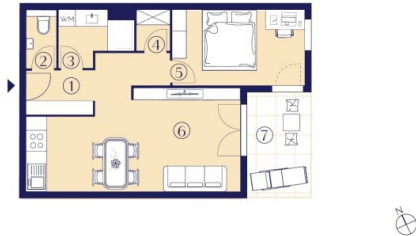
TYP 1 2 Zimmer – 48-56 m 2

Um die vielfältigen Bedürfnisse unserer Bewohner:innen zu erfüllen, präsentieren wir eine umfassende Auswahl an Wohnungsgrundrissen. Innerhalb dieser Vielfalt lassen sich zwei wesentliche Grundrisstypen erkennen: Typ 1 umfasst kompakte 48-56 m 2 mit 2 Zimmern, während Typ 2 großzügige 68-81 m 2 mit 3 Zimmern bietet. Unabhängig von der gewählten Wohnung steht jeder/m Bewohner:in eine eigene Freifläche zur Verfügung – ein zusätzlicher Raum für Entspannung und Erholung im Freien.