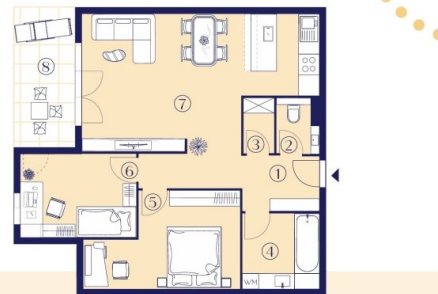
TYP 2 3 Zimmer – 68-81 m 2

Intelligente Grundrisse in der Architektur bilden die Grundlage für erfolgreiche Wohnkonzeptionen.