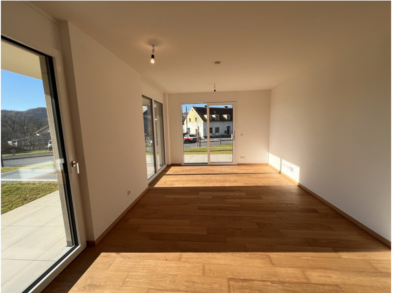
Wohnzimmer mit Küche