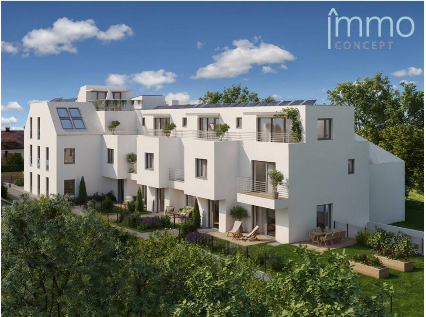
Ansicht Parkgarten Mauer