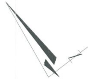
WOHNUNGSPLAN TOP 07 ALTBAUSANIERUNG "ALTE LANDSTRASSE" - THÜRINGEN 1. OBERGESCHOSS