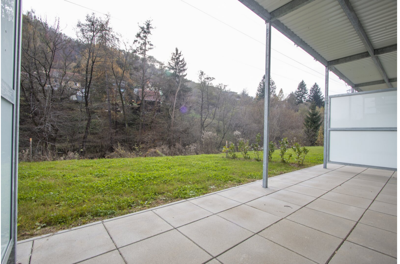
Terrasse und Garten