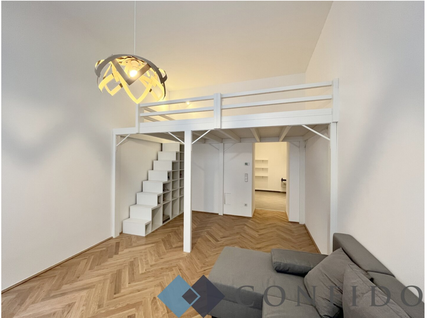
Wohnzimmer mit Hochbett