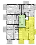
Übersicht 3. Obergeschoss