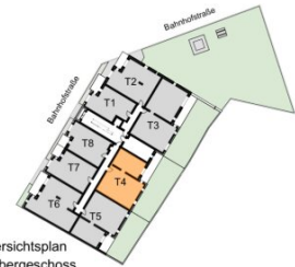
Übersichtsplan 1. Obergeschoss

Wohnfläche ca. 79,60 m 2 Balkon / Terrasse ca. 20,62 m 2 Loggia ca. 4,14 m 2 Garten ca. 58,80 m 2 Raumhöhe ca. 2,54 m