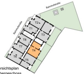
Übersichtsplan 1. Obergeschoss

Wohnfläche ca. 79,60 m 2 Balkon / Terrasse ca. 20,62 m 2 Loggia ca. 4,14 m 2 Garten ca. 58,80 m 2 Raumhöhe ca. 2,54 m