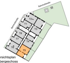
Übersichtsplan 1. Obergeschoss

Wohnfläche ca. 80,02 m 2 Balkon / Terrasse ca. 5,74 m 2 Loggia ca. 7,61 m 2 Garten ca. 42,13 m 2 Raumhöhe ca. 2,54 m