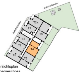
Übersichtsplan 1. Obergeschoss

Wohnfläche ca. 79,60 m 2 Balkon / Terrasse ca. 20,62 m 2 Loggia ca. 4,14 m 2 Garten ca. 58,80 m 2 Raumhöhe ca. 2,54 m