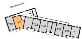
Übersichtsplan 3. Obergeschoss