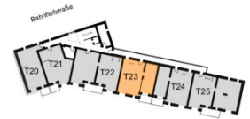
Übersichtsplan 3. Obergeschoss

Wohnfläche ca. 79,43 m 2 Balkon / Terrasse ca. 6,45 m 2 Raumhöhe ca. 2,54 m