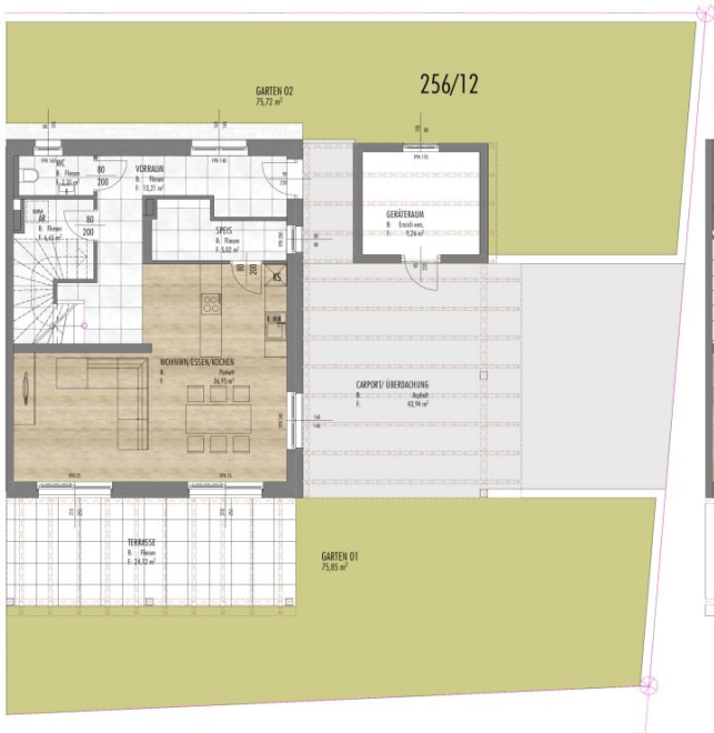
0. EG VKP 1:100