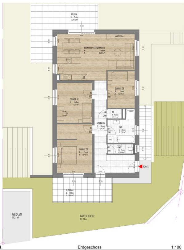
1. Erdgeschoss 1:100