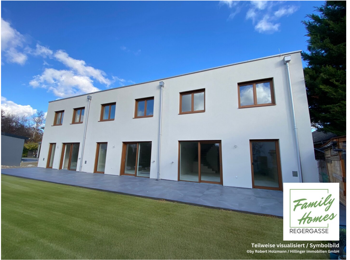
Teilweise visualisiert / Symbolbild