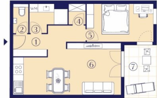
TYP 1 2 Zimmer – 48-56 m 2

Um die vielfältigen Bedürfnisse unserer Bewohner:innen zu erfüllen, präsentieren wir eine umfassende Auswahl an Wohnungsgrundrissen. Innerhalb dieser Vielfalt lassen sich zwei wesentliche Grundrisstypen erkennen: Typ 1 umfasst kompakte 48-56 m 2 mit 2 Zimmern, während Typ 2 großzügige 68-81 m 2 mit 3 Zimmern bietet. Unabhängig von der gewählten Wohnung steht jeder/m Bewohner:in eine eigene Freifläche zur Verfügung – ein zusätzlicher Raum für Entspannung und Erholung im Freien.