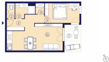
TYP 1 2 Zimmer – 48-56 m 2

Um die vielfältigen Bedürfnisse unserer Bewohner:innen zu erfüllen, präsentieren wir eine umfassende Auswahl an Wohnungsgrundrissen. Innerhalb dieser Vielfalt lassen sich zwei wesentliche Grundrisstypen erkennen: Typ 1 umfasst kompakte 48-56 m 2 mit 2 Zimmern, während Typ 2 großzügige 68-81 m 2 mit 3 Zimmern bietet. Unabhängig von der gewählten Wohnung steht jeder/m Bewohner:in eine eigene Freifläche zur Verfügung – ein zusätzlicher Raum für Entspannung und Erholung im Freien.