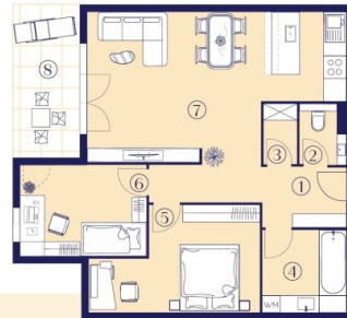
TYP 2 3 Zimmer – 68-81 m 2

Intelligente Grundrisse in der Architektur bilden die Grundlage für erfolgreiche Wohnkonzeptionen.