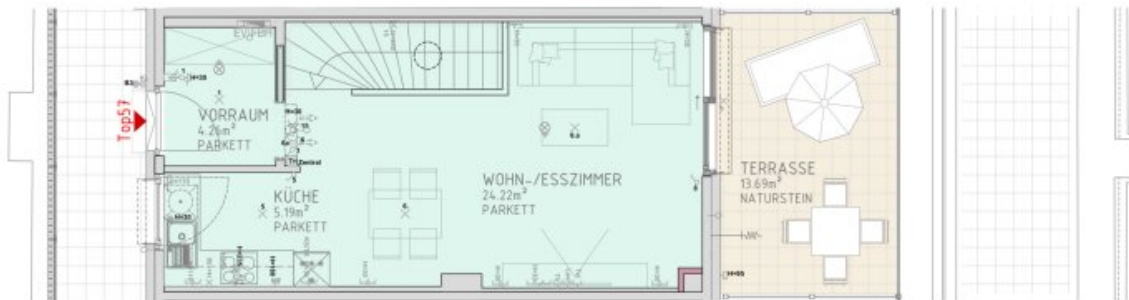
2.DACHGESCHOSS M 1:50