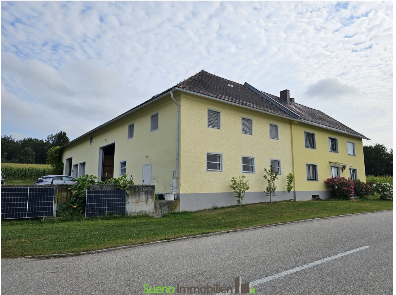
Fassade Süd West Ansicht