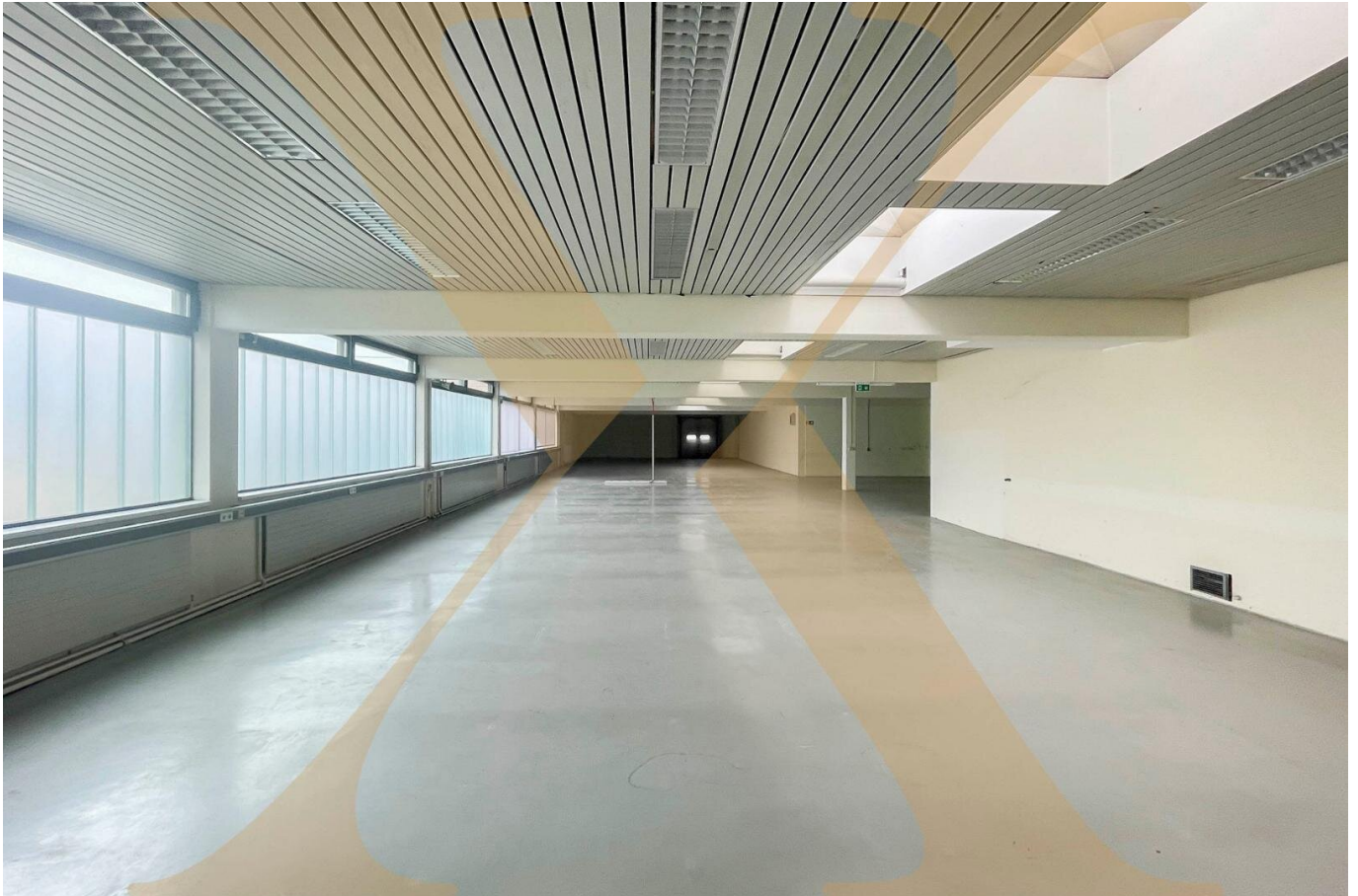
Innenansicht Lagerfläche I