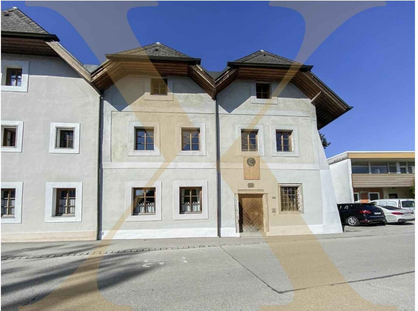
Außenansicht Haus I