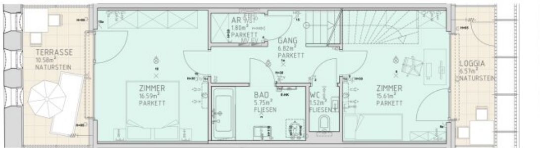
1.DACHGESCHOSS M 1:50