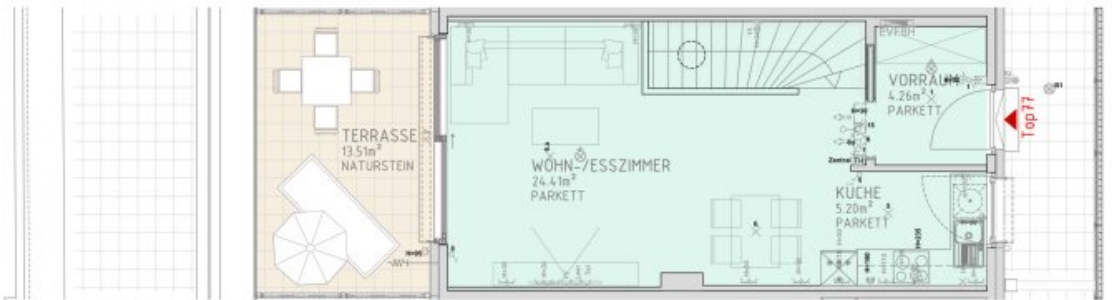
2.DACHGESCHOSS M 1:50