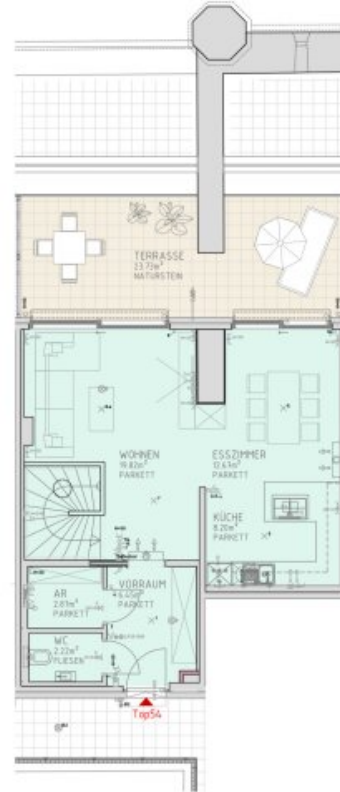
2.DACHGESCHOSS M 1:75