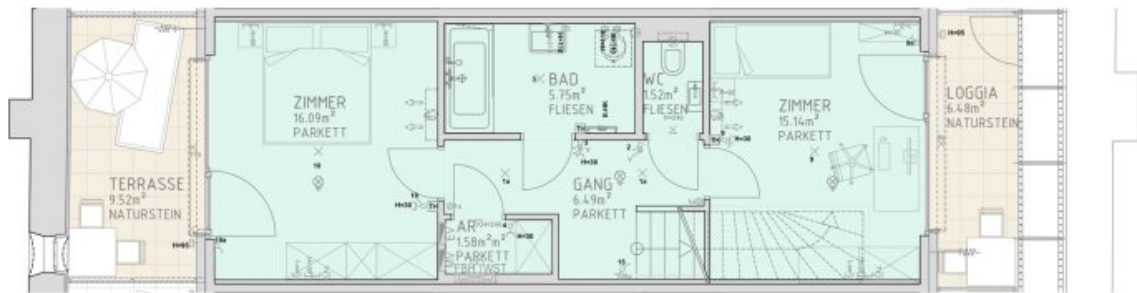
1.DACHGESCHOSS M 1:50