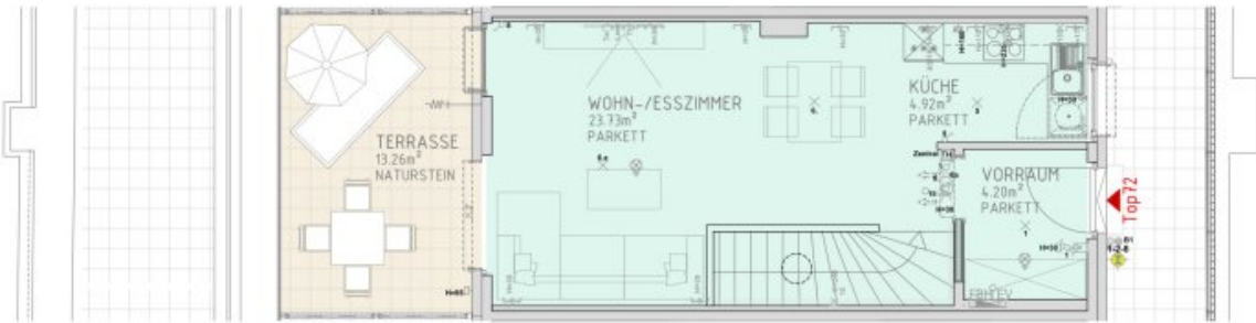
2.DACHGESCHOSS M 1:50