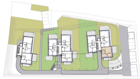
0. Erdgeschoss Haus A 75 1:100