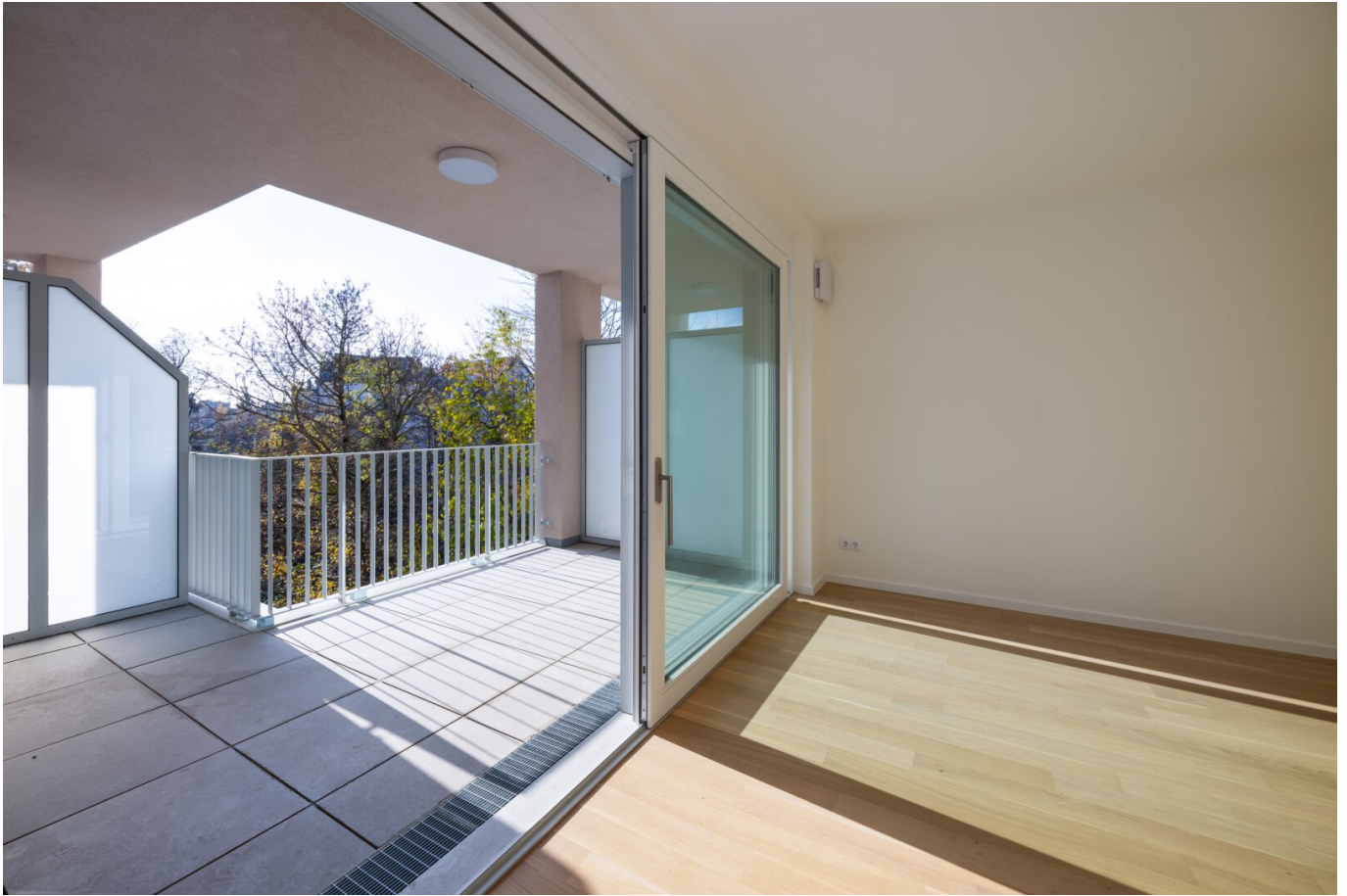
Balkon und Wohnküche

Objektnummer: 1575/151 Eine Immobilie von Pia Estate GmbH