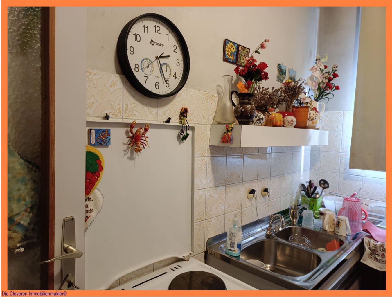
Die Cleveren Immobilienmakler©