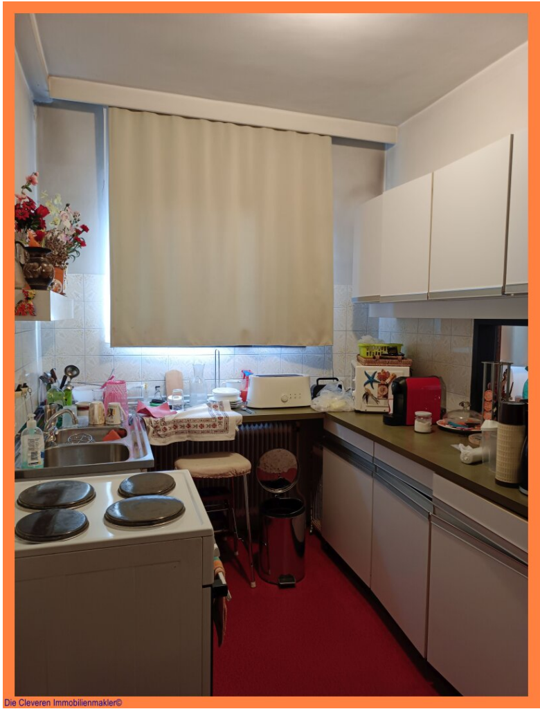
Die Cleveren Immobilienmakler©