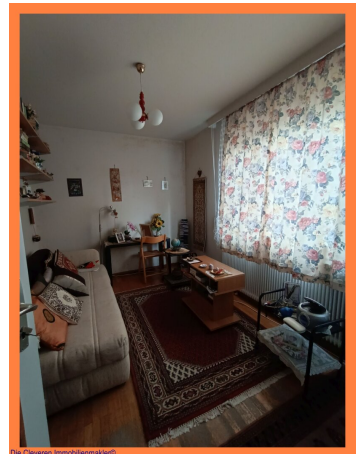
Die Cleveren Immobilienmakler©