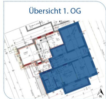
Übersicht 1. OG