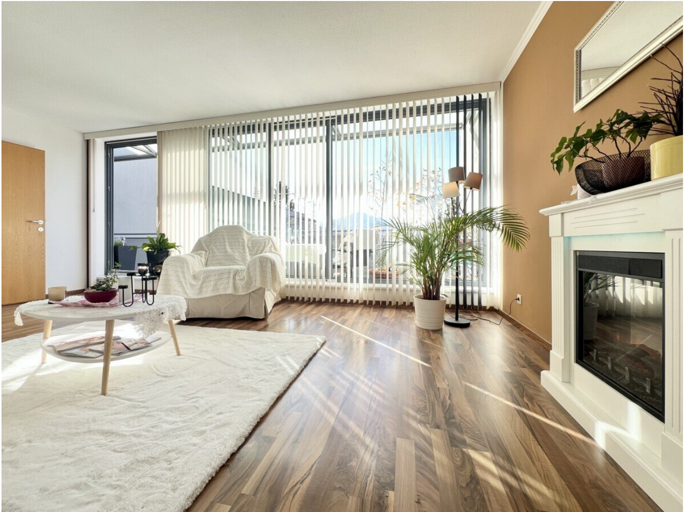
Helles Wohnzimmer mit bodentiefer Fensterfront