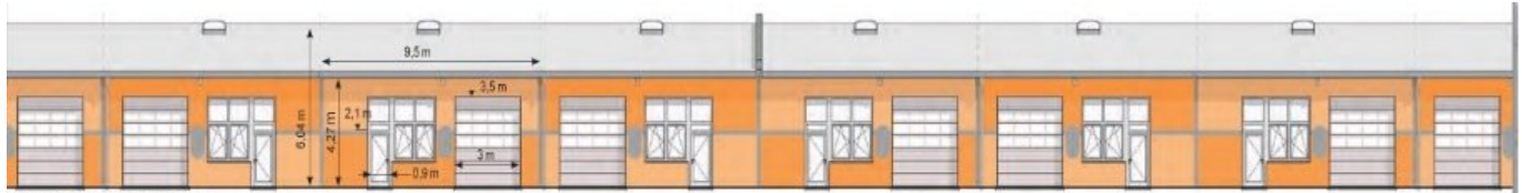
Gewerbehalle-01 Ansicht Nord