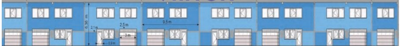
Gewerbehalle-02 Ansicht Nord