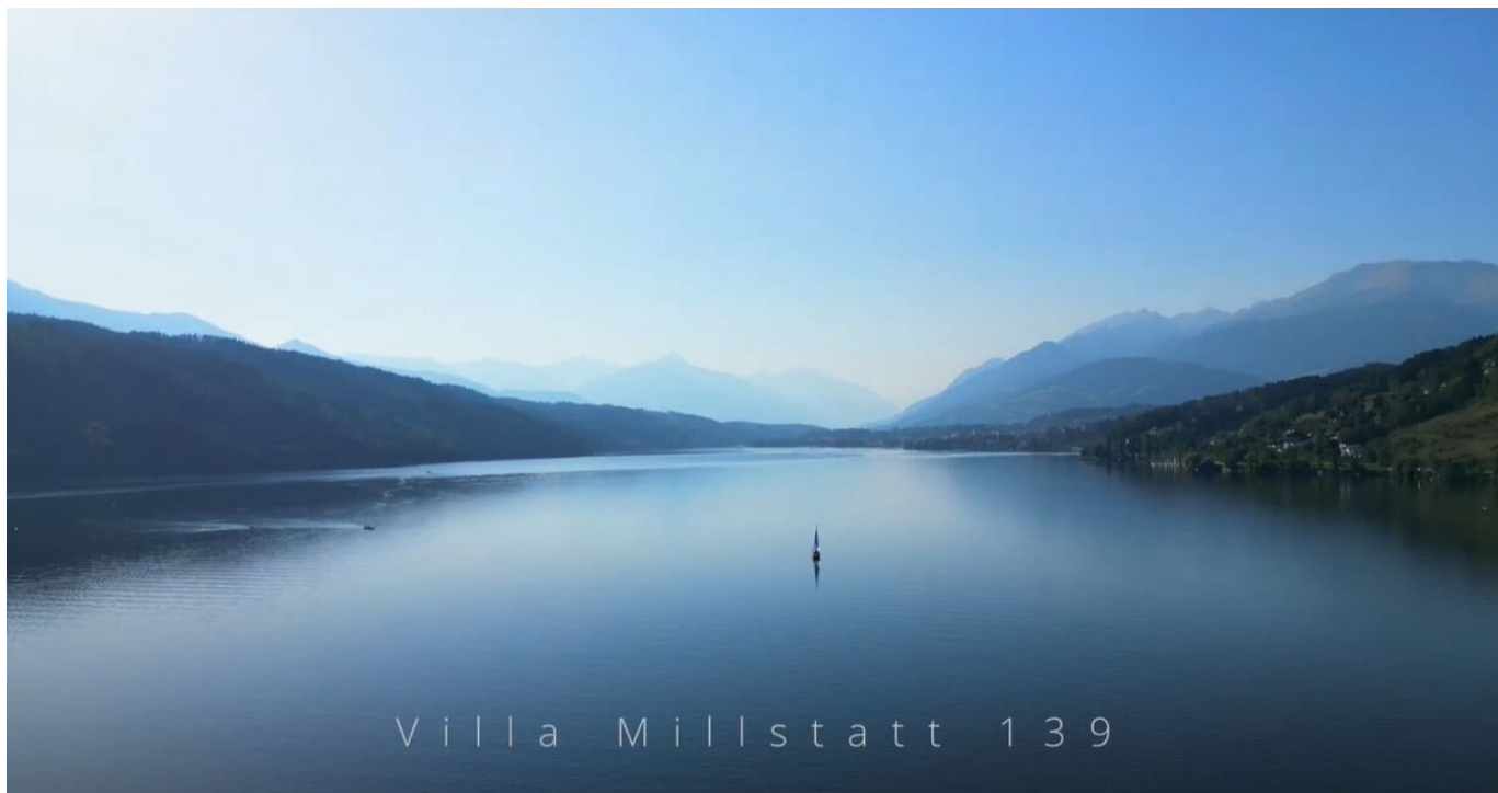
Villa Millstatt 139