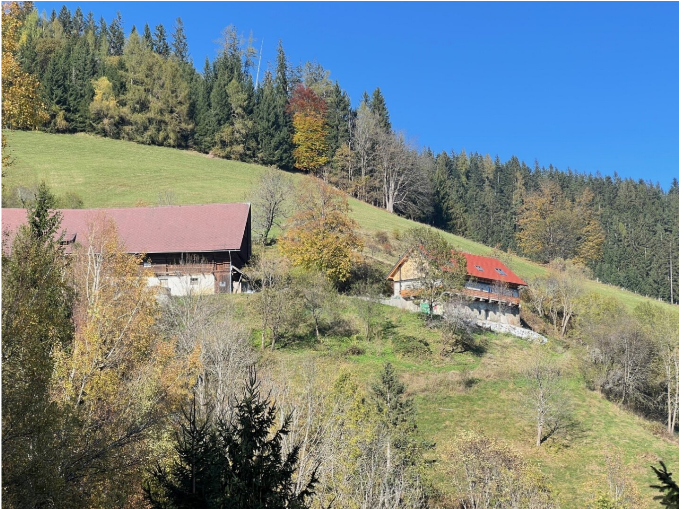
Wohnhaus und Stallgebäude