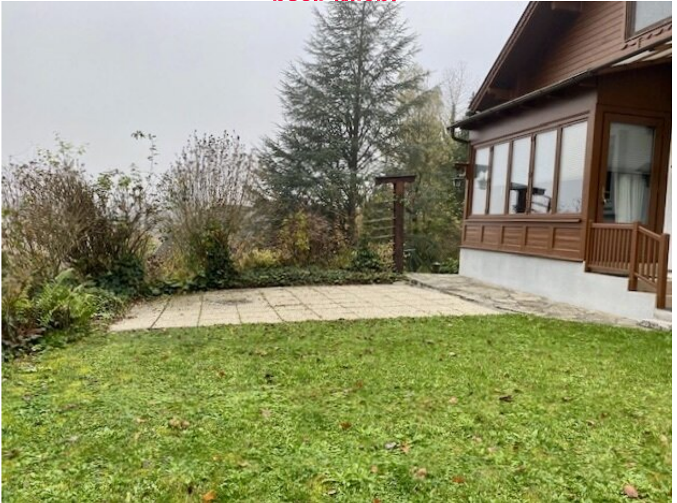
Terrasse mit Vorgarten

Einfamilienhaus auf 2815 m 2 Grund, idyllisch gelegen mit herrlichem Fernblick: Wohnebene + Dachboden, Kellerhaus, Garage, Erd-Weinkeller, Schrägaufzug, am Ortsrand Kirchstetten, Nähe A1 + Westbahn, ca. 50 min. nach Wien!