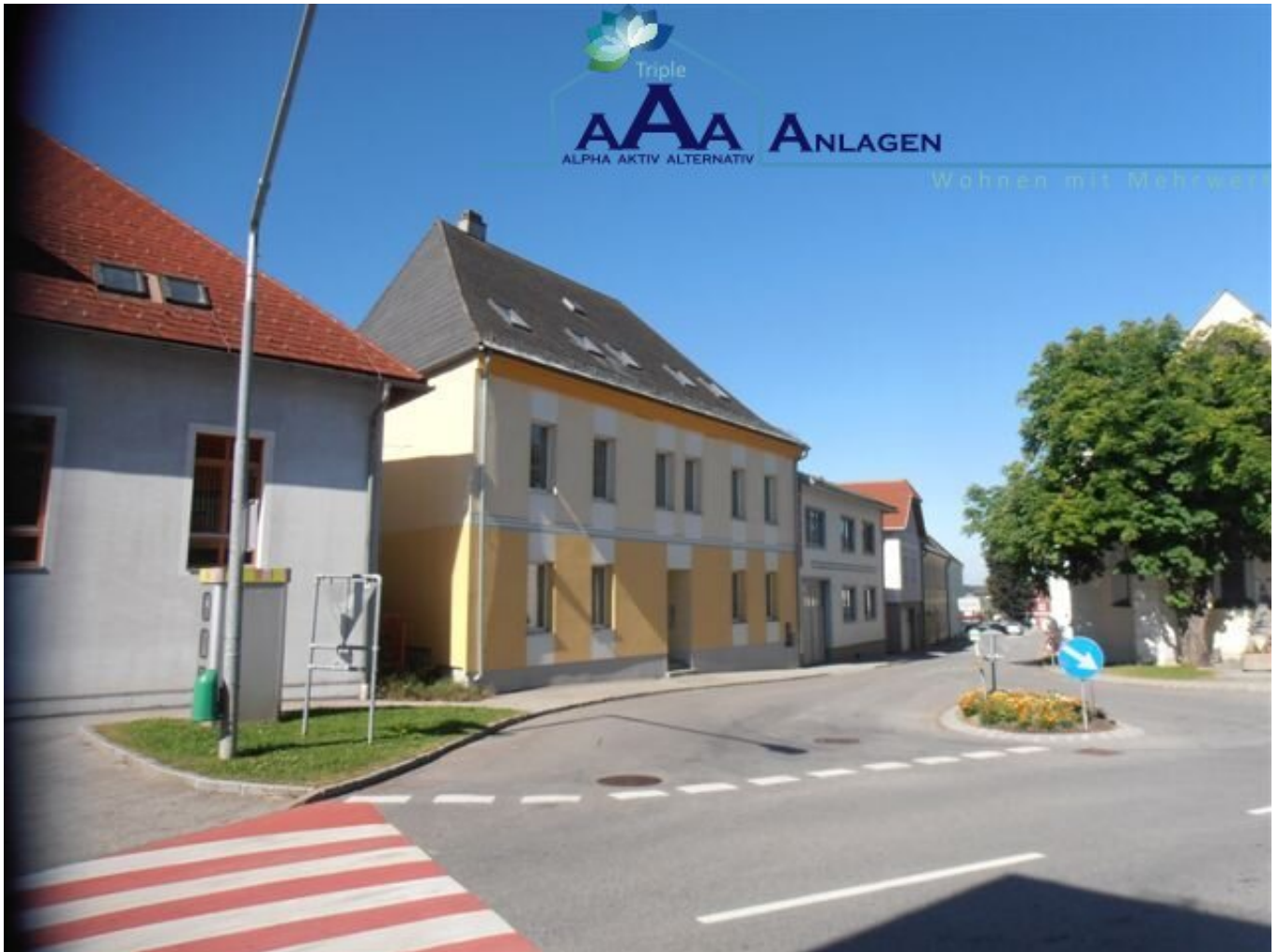
Hausansicht Oberer Markt