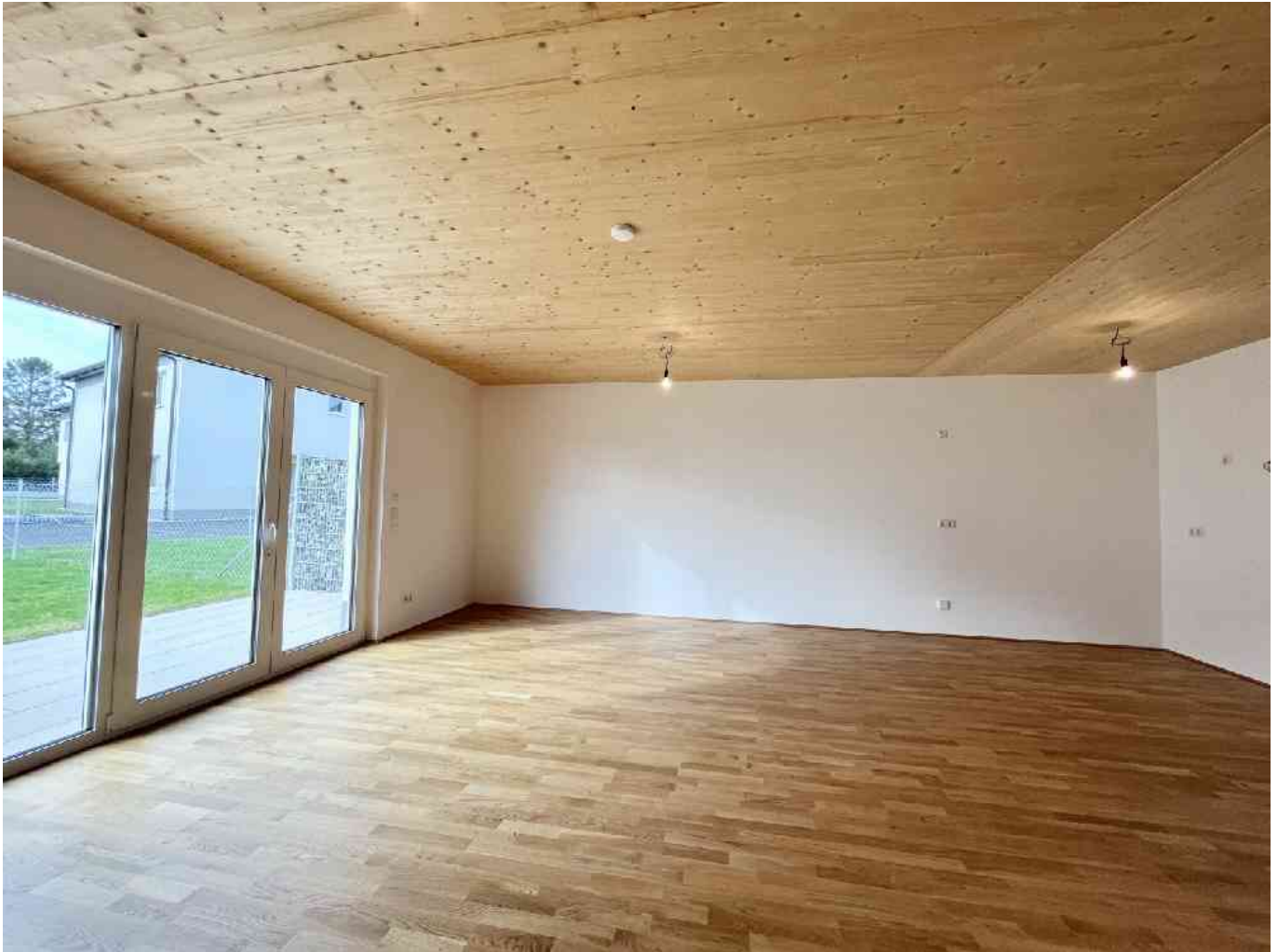
Wohnzimmer mit Ausga

Objektnummer: 141/81494 Eine Immobilie von Rustler