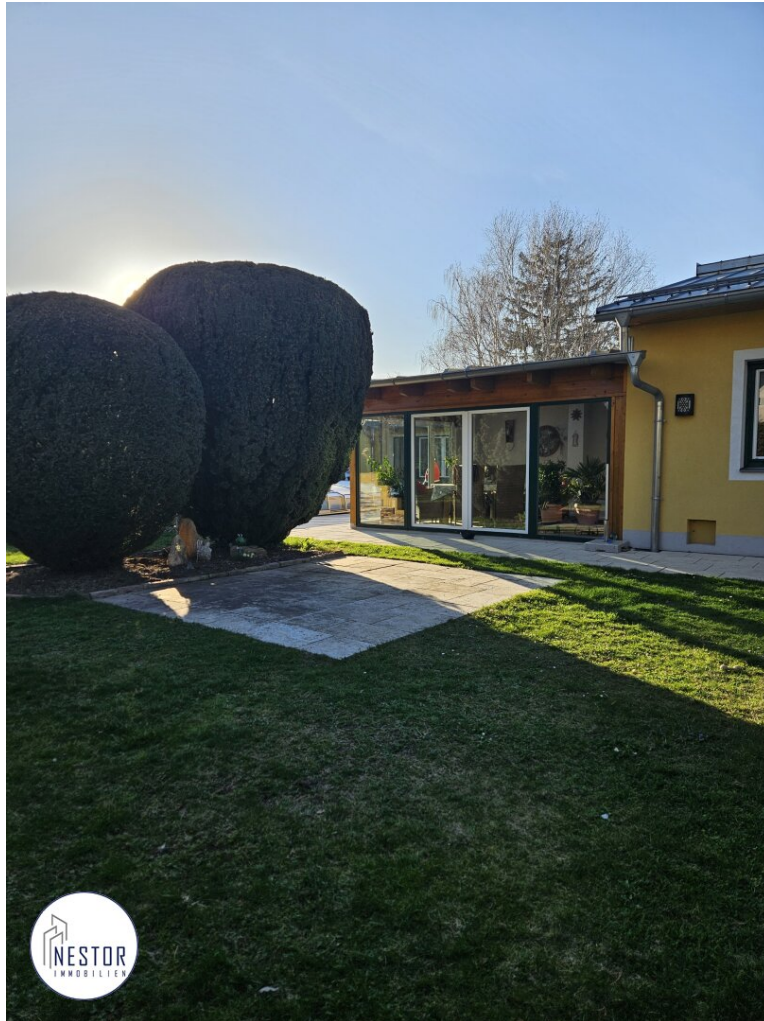
Haus - NESTOR Immobilien