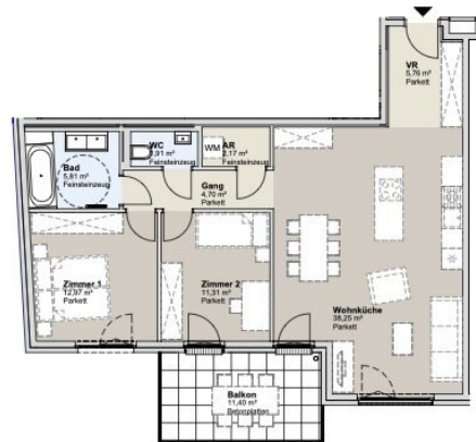
1. STOCK STRASSENBAUKÖRPER