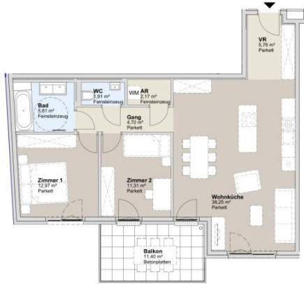
1. STOCK STRASSENBAUKÖRPER