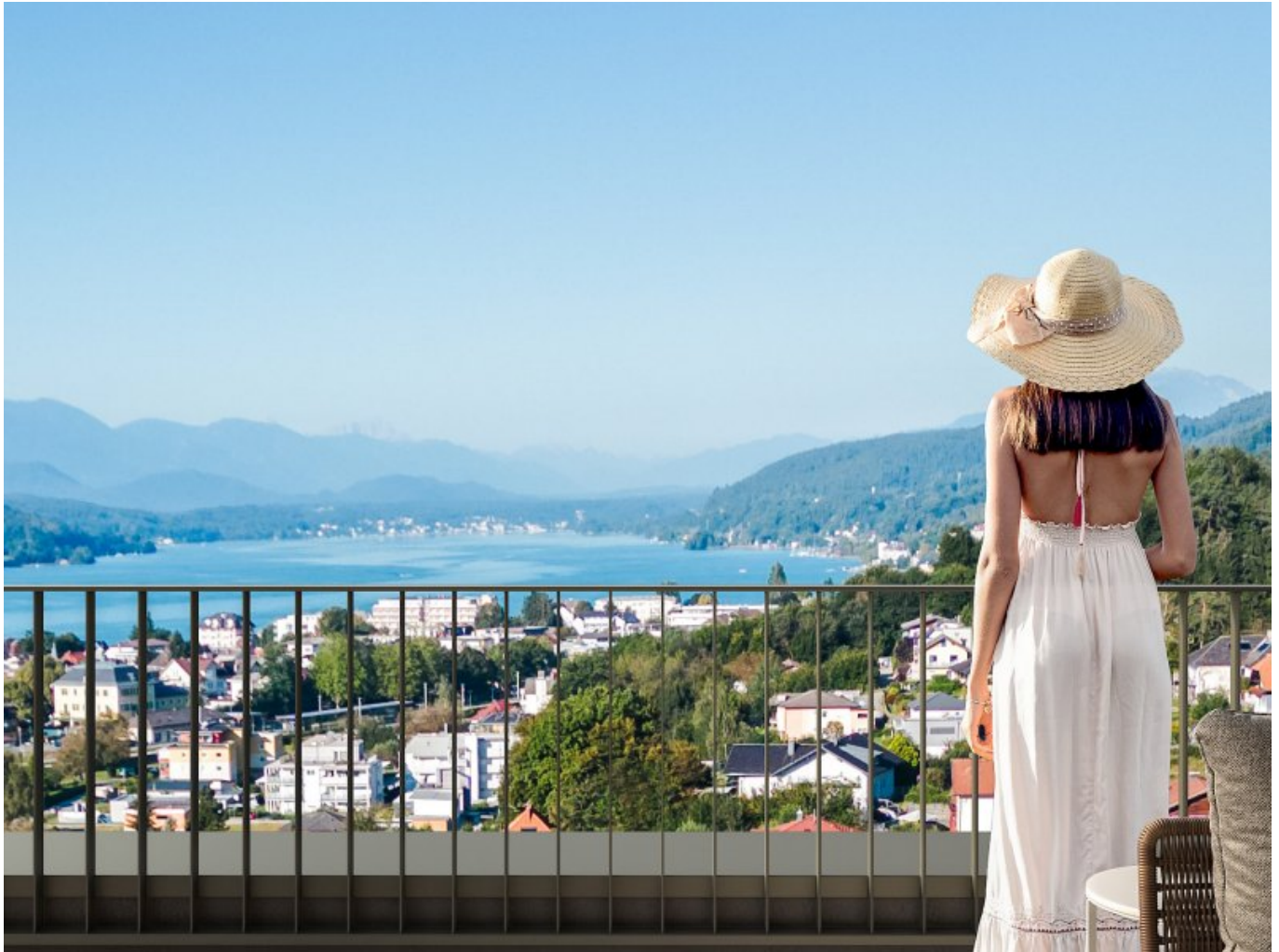
Visu 6 Neu

Objektnummer: 905/03420 Eine Immobilie von ATV Immobilien