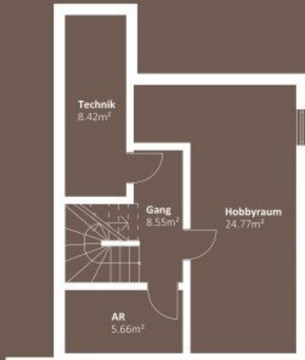
KELLERGEHOSS WNF 47,40m 2