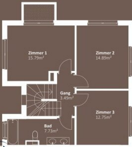
OBERGEHOSS WNF 54,65m 2