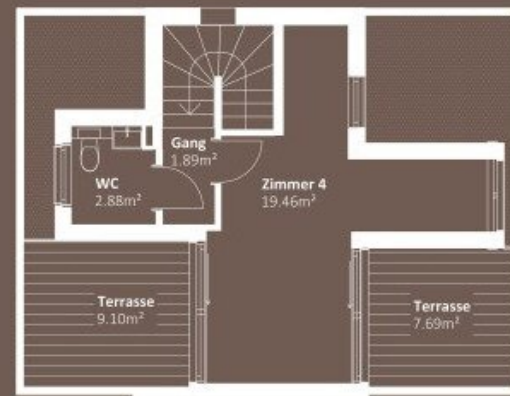
DACHGESCHOSS WNF 24,23m 2