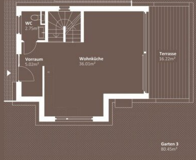
ERDGESCHOSS WNF 43,78m 2