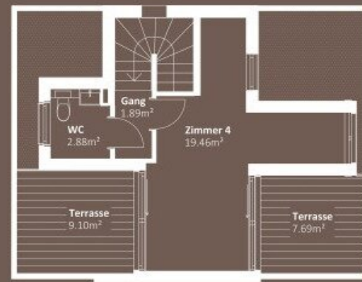
DACHGESCHOSS WNF 24,23m 2