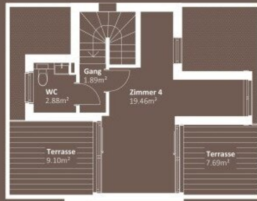
DACHGESCHOSS WNF 24,23m 2