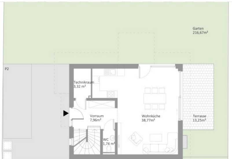
ERDGECHOSS WNF 51,79m²