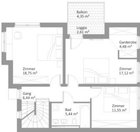
OBERGESCHOSS WNF 63,78m²