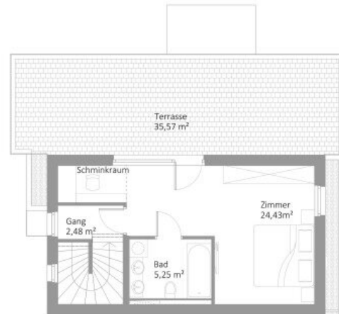
DACHGESCHOSS WNF 32,16m²