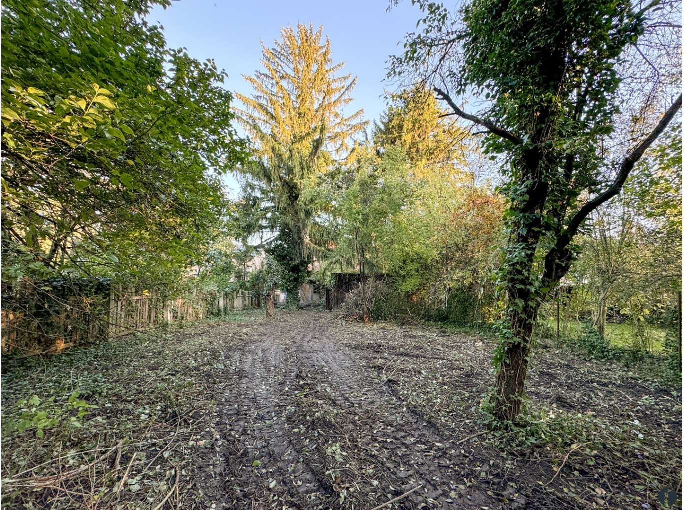
Blick Richtung Norden