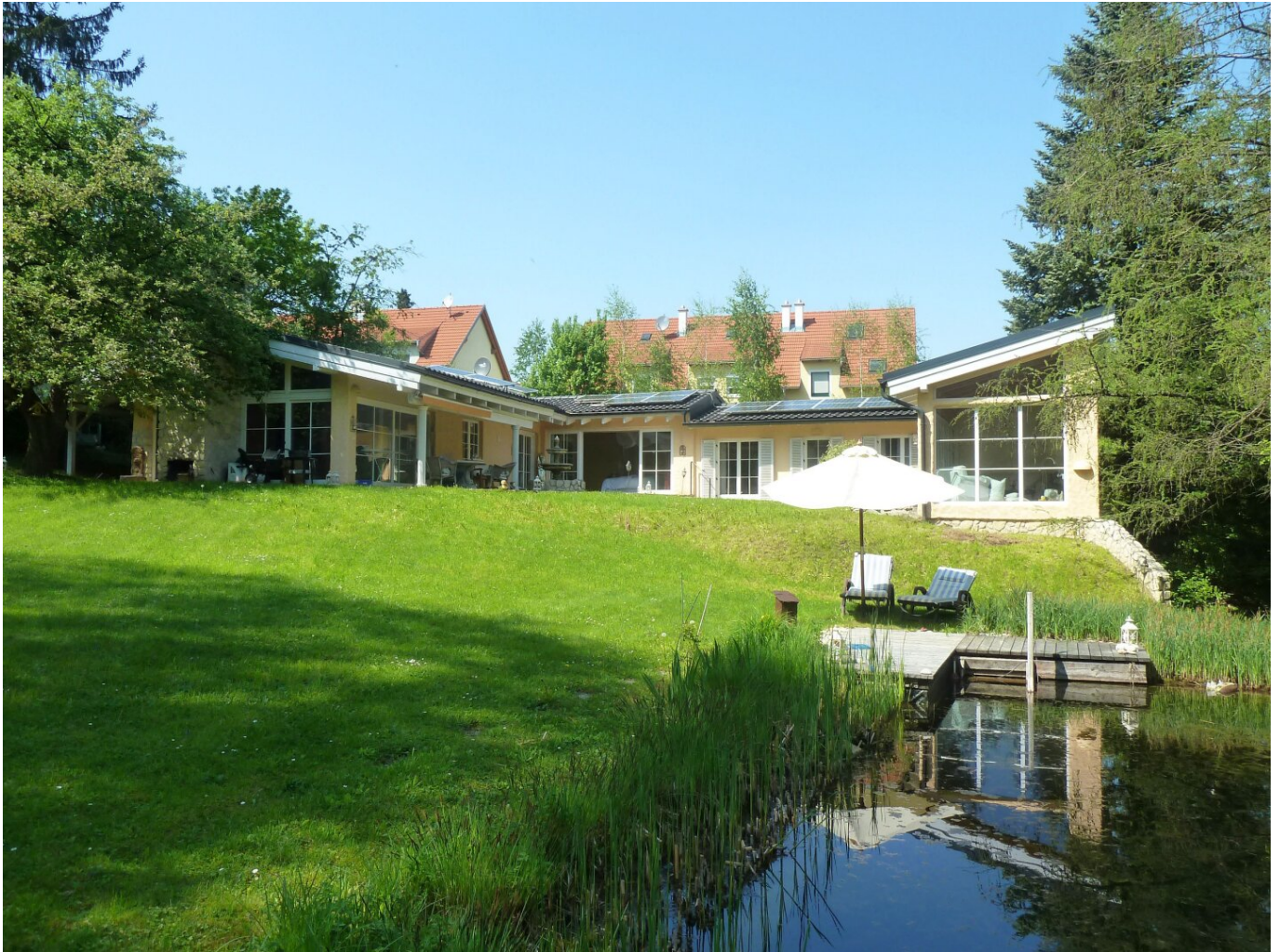
Hausansicht mit Schwimmteich