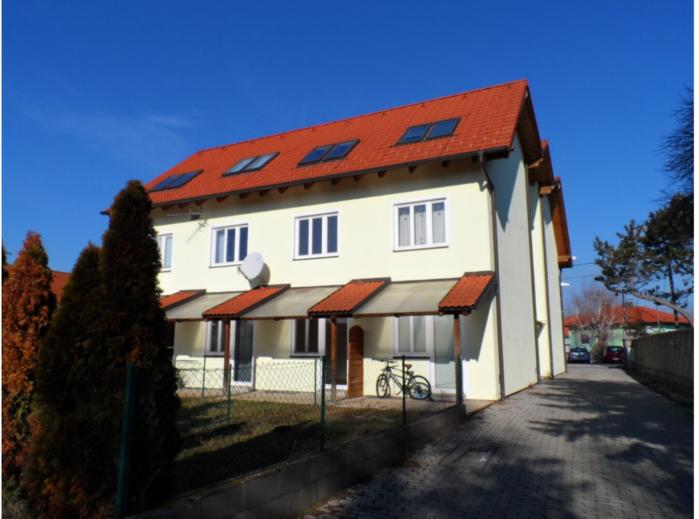
Blick vom Hof zum Haus