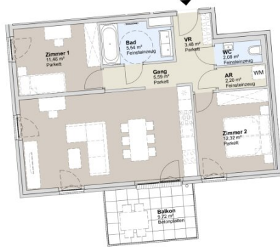
1. STOCK GARTENBAUKÖRPER